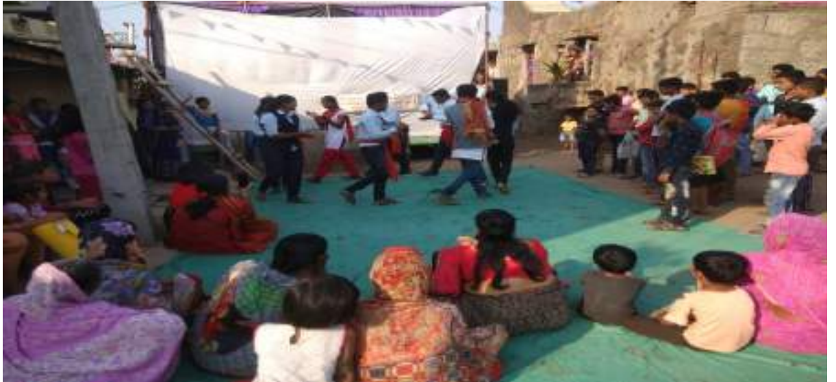
शिरुड ता. अमळनेर येथील कार्यक्रमाचा लोकप्रतिसाद-