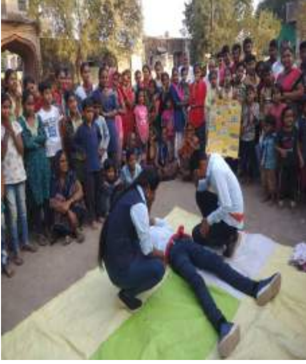
तासखेडा ता. अमळनेर येथील कार्यक्रमाचा लोकप्रतिसाद-