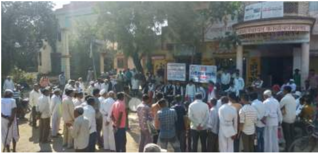
कार्यक्रमानंतर मारवाड गावातील प्रतिष्ठित नागरिकांसोबत -