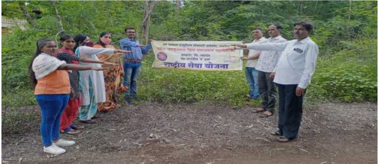
Photograph of the program