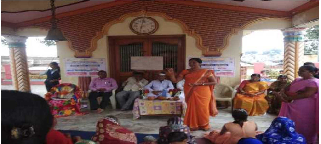
Photograph of program

Collaboration – Shivaji Nagar Youth Club Pailad Amalner