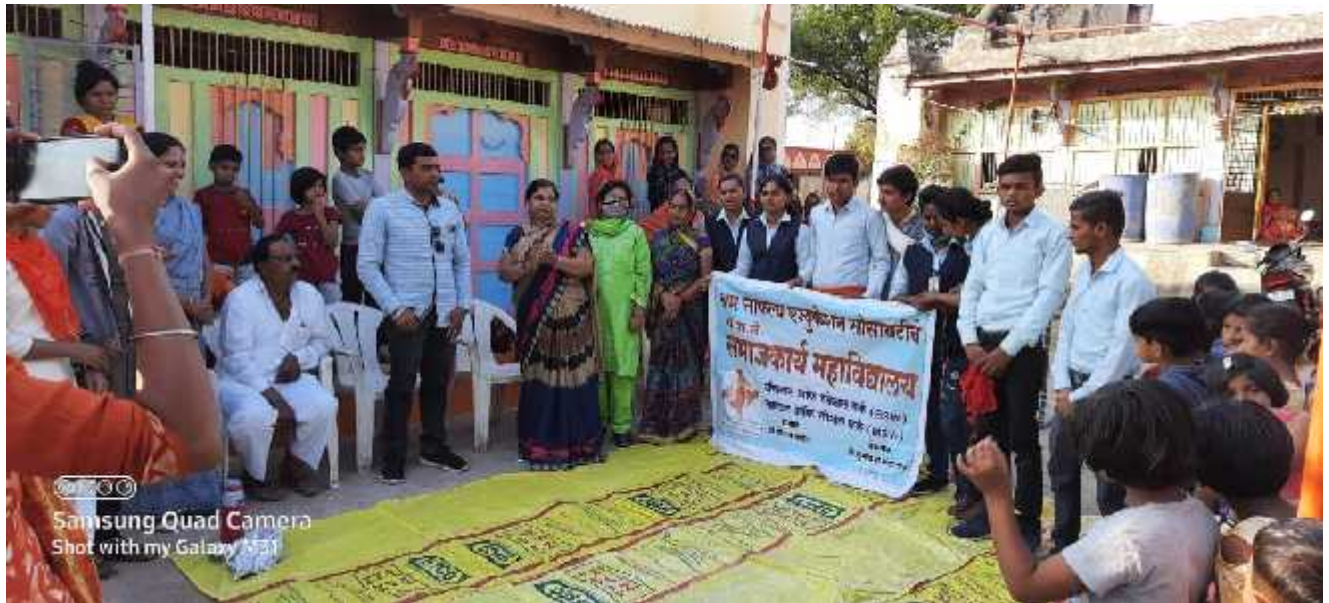
Photograph of program