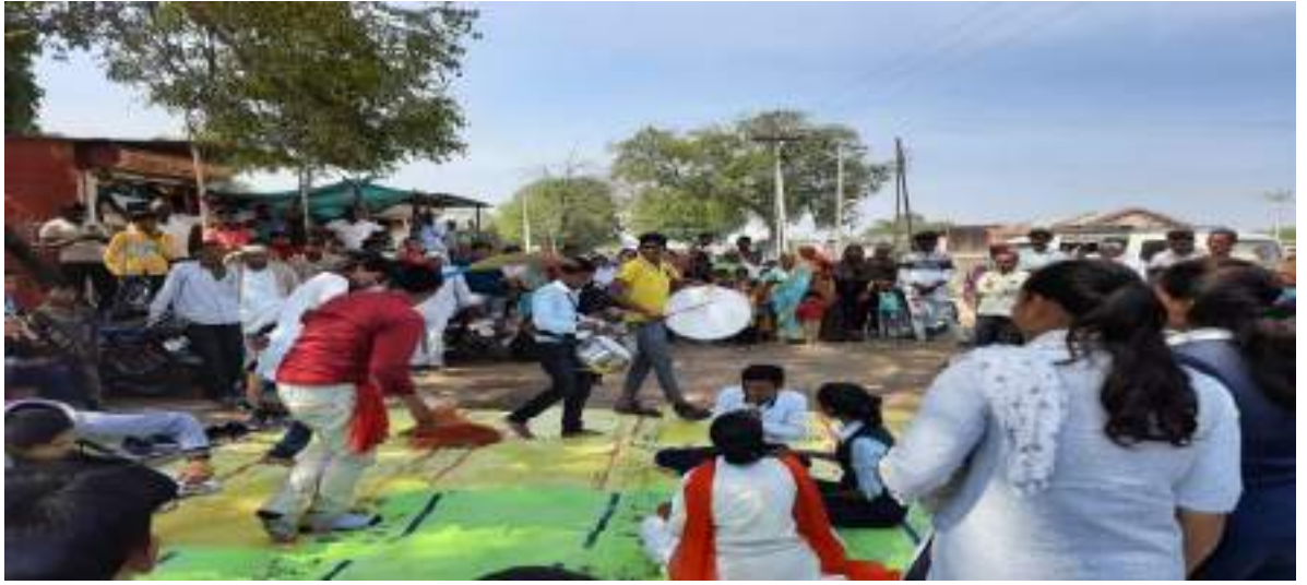
नंदगाव ता. अमळनेर येथील कार्यक्रमाचा लोकप्रतिसाद-